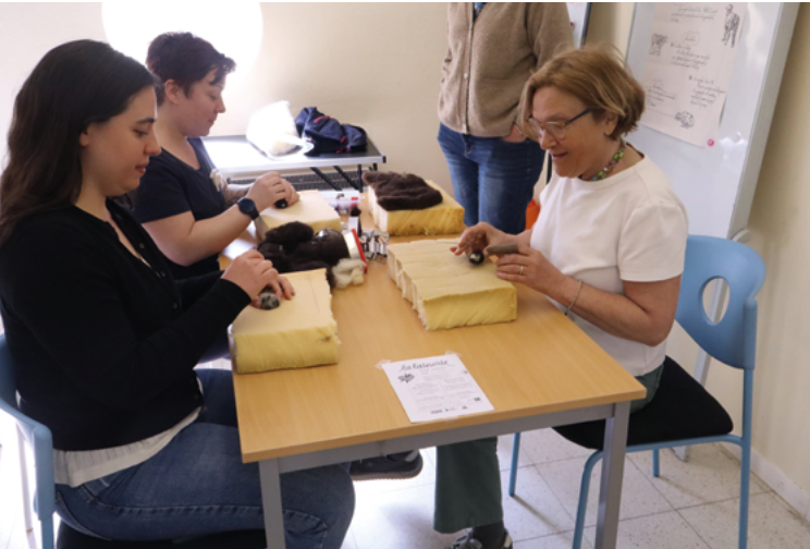
Atelier de feutrage par La Lainerie

Venez seul(e), en famille ou entre voisins... Le Foodtruck Solidaire, c'est ouvert à tous !